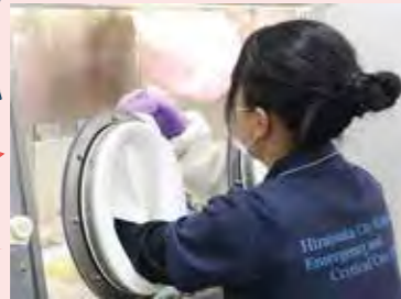
薬剤のミキシングを体験