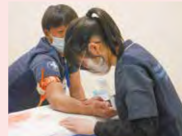
止血法を学びました