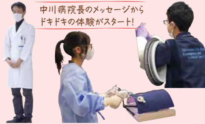
中川病院長のメッセージからドキドキの体験がスタート!

さまざまな地域から来られた未来の医療人たち全29名が、病院内の各現場をまわり実践的な体験をしました。