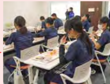
参加者からの質問にスタッフが答えるトークライブ