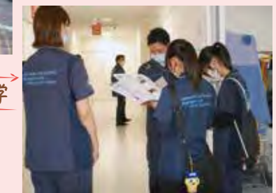
ER(救命救急センター)見学