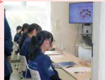
血液型検査の仕組みを学びました