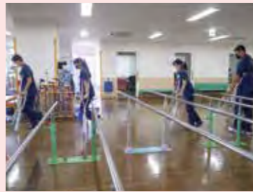
リハビリテーション体験