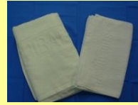
バスタオル フェイスタオル