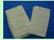
バスタオル フェイスタオル