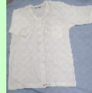
女性用 肌着 M~LL